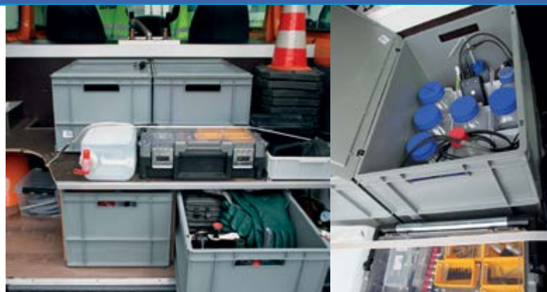
Ausstattung eines neuen KKK-Einsatzfahrzeugs in Eigenregie 2014