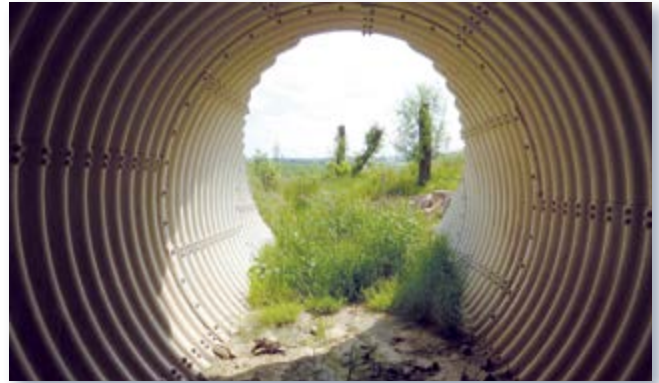
naturnahe Gestaltung der Gewässersohle im Durchlass

Der Zu- und Ablaufbereich des Durchlasses wurde mit Ufersicherungen und eingebrachten Steckhölzern an das natürliche Gewässer angebunden und so eine weitgehende naturnahe Gestaltung des Schmalbeckbaches auf ca. 120 m Länge erreicht. Auf einer Ausgleichsfläche im angrenzenden Bereich wurde mit standortgemäßer Bepflanzung und Anlage einer Staumulde ein korrespondierendes Gewässerumfeld gestaltet.