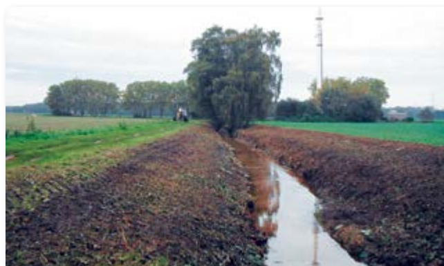
während der Maßnahme