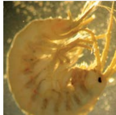
Gewöhnlicher Flohkrebs ( Gammarus pulex )