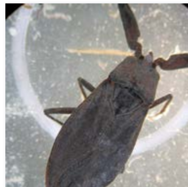
Wasserskorpion ( Nepa cinerea )