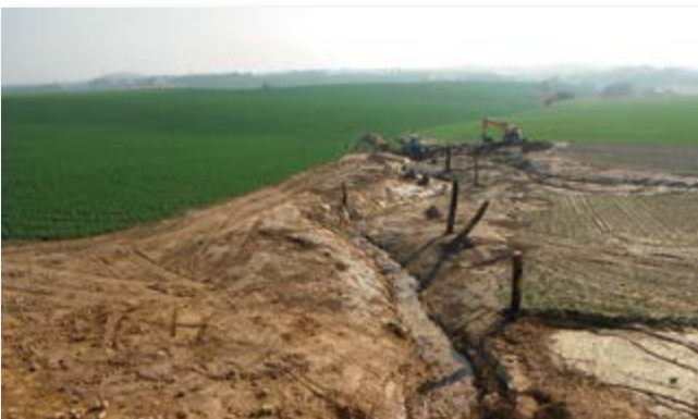
naturnahe Gestaltung des Schmalbeckbaches im Auslaufbereich des Durchlasses direkt nach dem Bau