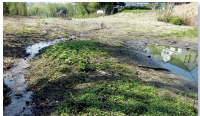
vor, während und nach der Umgestaltung