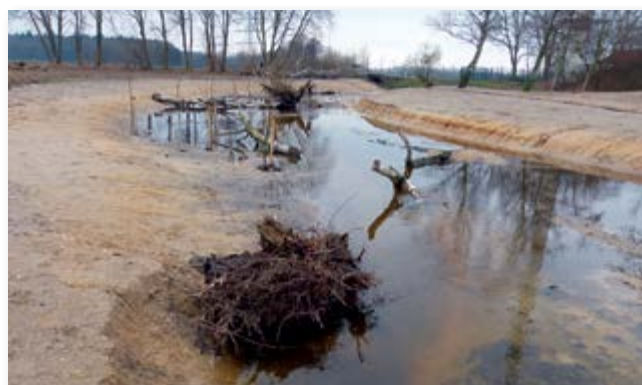
unmittelbar nach Fertigstellung der Maßnahme