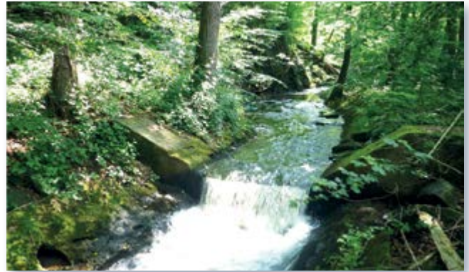
Sohlabschurz vor und Sohlgleite nach der Umgestaltung

Ohne Durchgängigkeitshindernis und mit dem Rückbau der Sohl- und Uferbefestigung kann sich nun dieser ökologisch aufgewertete Bachabschnitt auf Dauer zu einem funktionsfähigen Trittstein entwickeln.