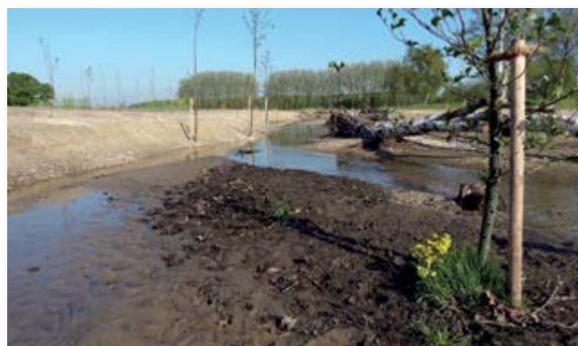
Entwicklung nach 3 Monaten