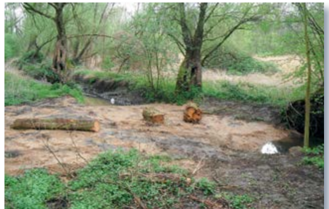
Verfüllung altes Bett