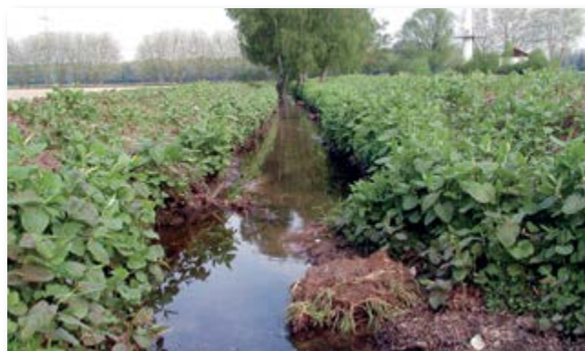
vor der Maßnahme, Bewuchs mit japanischem Knöterich

Dafür wurde eine ca. 15 m breite neue Trasse neben dem alten Bachbett hergestellt, die Raum für eine Sekundäraue bietet und dem Gewässer die Möglichkeit gibt, das Fließgerinne selbst auszubilden. Die Uferbereiche sind mit geschwungenen Böschungsoberkanten und wechselnden Gefälleneigungen variabel. Es wurde Totholz eingebracht und die Pflanzung einer ufertypischen Vegetation mit Gehölzen und krautigen Arten durchgeführt. Der mit dem Knöterich befallene Oberboden wurde in der alten Bachtrasse eingebaut, mit einem Fließ abgedeckt und übererdet. Eine zusätzlich eingebaute Rhizomsperr verhindert die erneute Ausbreitung des Knöterichs in Richtung des Gewässers.