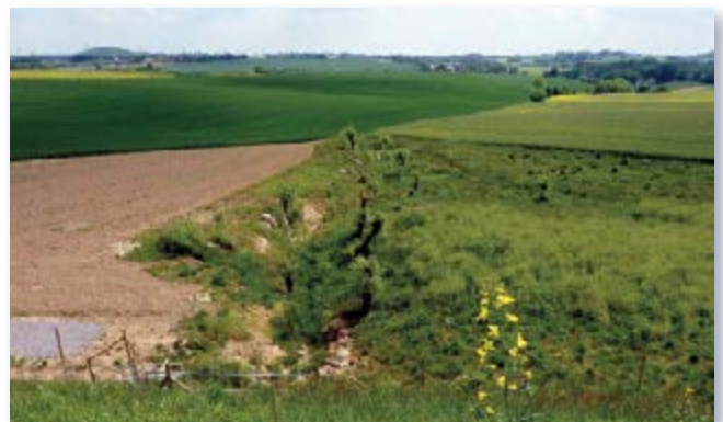
und einige Monate später