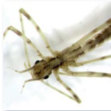
Larve der Gebänderten Prachtlibelle ( Calopteryx splendens )

Auf den nächsten Seiten wird über verschiedene naturnahe Umgestaltungsmaßnahmen berichtet, die in diesem Jahr realisiert werden konnten.