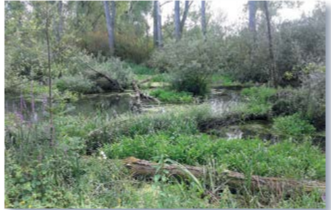
Das Niedrigwassergewässer entwickelt sich.

In diesem Jahr wurden verbandsseitig noch Teilbereiche des ehemaligen Gewässerverlaufs hinter dem Sommerdeich verfüllt und von der Stadt Düsseldorf wurden zwei Brücken über die Deichöffnungen gebaut, sodass ein auf dem Deich verlaufender, beliebter Naherholungsweg wieder genutzt werden kann.