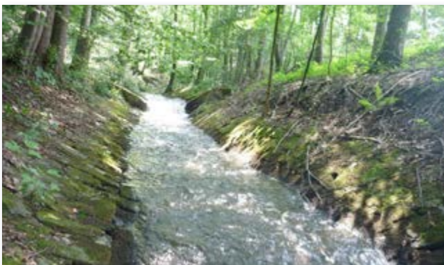
vor und nach dem Rückbau des Uferverbau