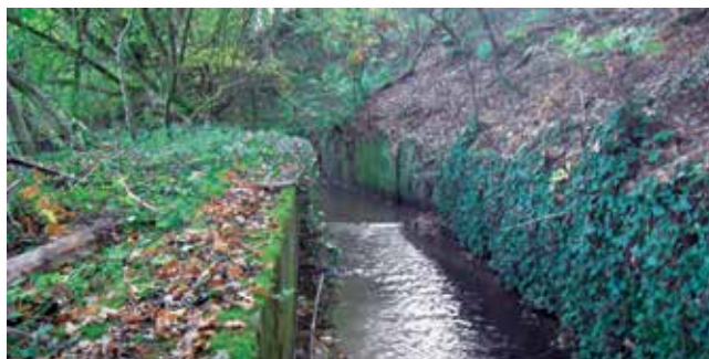
vor und nach der Umgestaltung

Im Zuge der Maßnahme wurde der Mettmanner Bach hierbei parallel zum Bauwerk auf ca. 60 m verschwenkt und ober- und unterhalb wieder angebunden. Die Verfüllung des Troges erfolgte mit dem gewonnenen Aushubboden. In diesem Abschnitt kann sich das Gewässer durch die naturnahe Gestaltung jetzt wieder seitlich entwickeln. Es hat zudem eine natürliche Sohle mit Sohlssubstrat und ist durch Totholzeinbau und Bepflanzung strukturell aufgewertet. Der Kreis Mettmann hat als Bauherr der Osttangente dem BRW die Kosten für die Durchführung dieser Arbeiten erstattet.