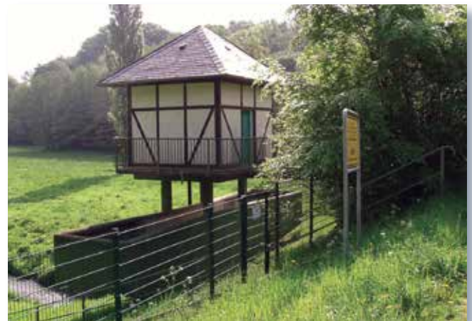
Entlastungsbauwerk HRB Kuckesberg