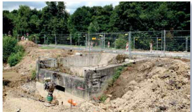
HRB Goldberger Teich Abbruch des Überlaufbauwerks

Mit dem Beginn der Bauarbeiten zur Sanierung des HRB GOLDBERGER TEICH in Mettmann, Mitte Juli, steht in absehbarer ein mehr als 20 Jahre altes Projekt vor dem Abschluss. Bis zum Jahresende konnten das Überlaufbauwerk mit Grundablass sowie der Rohbau des Betriebsgebäudes fertiggestellt werden. Das ehrgeizige Ziel, schon zum Jahresende wieder einen störungsfreien Verkehr über die Goldberger Straße zu ermöglichen, die auf dem Absperrdamm verläuft, wurde leider verfehlt. Es ist zu befürchten, dass durch das zum Jahresende eingeleitete Insolvenzverfahrens bei der beauftragten Baufirma noch weitere Verzögerungen hinzukommen werden.