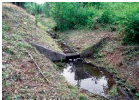
vor und nach der Umgestaltung

Die Maßnahme diente zur Kompensation des Eingriffs am Zechengraben, der durch den Umbau des Breitscheider Kreuzes (A3/A52) hervorgerufen wurde.