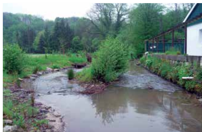
Die Entwicklung nach 10 Monaten