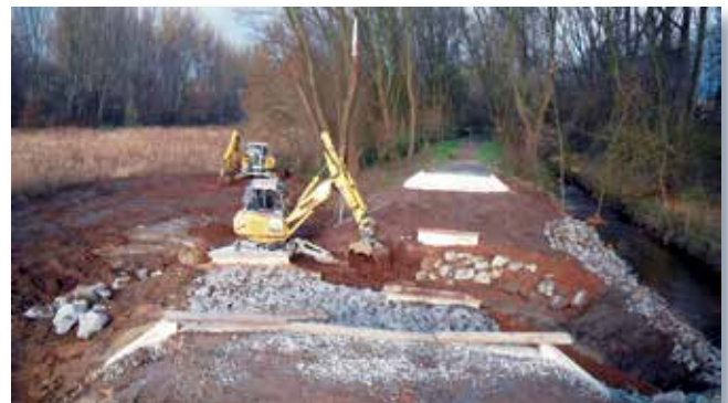
Profilierung des Einlaufbereiches und Sicherung der Brückenwiderlager mit Wasserbausteinen, daneben fließt der Urdenbacher Altrhein noch in seinem alten Bett