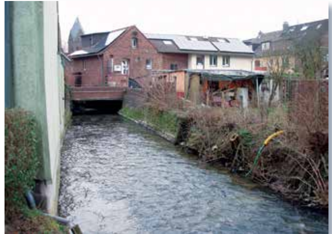
vor der Baumaßnahme

Seit Baubeginn im April werden die Arbeiten aufgrund der örtlichen Randbedingungen von zahlreichen Gutachtern und Sachverständigen begleitet. Trotz des ein oder anderen zum Zeitpunkt der Ausschreibung nicht erkennbaren Problems lagen sie zum Jahresende noch voll im Zeitplan und werden voraussichtlich Mitte des kommenden Jahrs abgeschlossen sein.