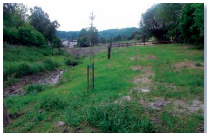
vor, während und nach der Umgestaltung