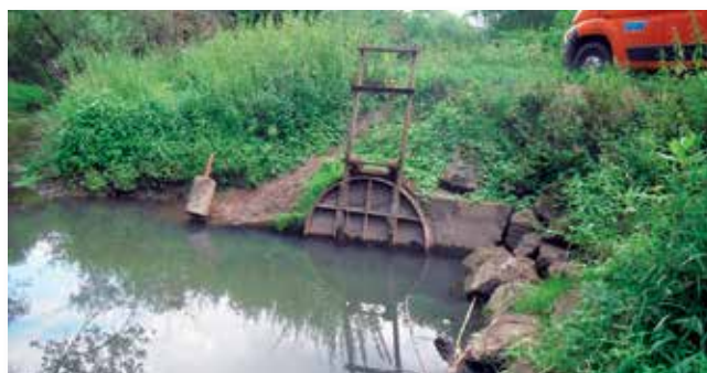
Doppeldurchlass mit Hochwasserschutzklappen am Auslauf des Baumberger Grabens

Seit den 1990er-Jahren haben die NRW-Stiftung und die Landeshauptstadt Düsseldorf sukzessive in der Kämpe insgesamt 150 Hektar Flächen erworben und nun bietet sich in der Urdenbacher Kämpe die landesweit einmalige Gelegenheit, auf einer Strecke von rund 2,5 Kilometern ein dem Leitbild entsprechendes typisches Niedrigungsgewässer wieder zu entwickeln. Dieser Gewässertyp existiert in Nordrhein-Westfalen seit geraumer Zeit nicht mehr. Dazu ist vorgesehen, im Bereich Düssel-