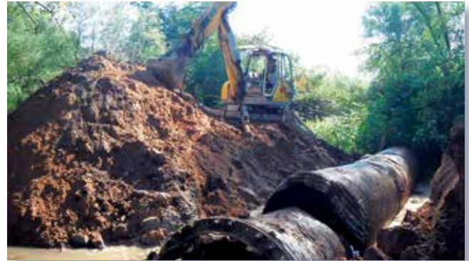
Rückbau des Doppeldurchlasses in D-Urdenbach, das größere der beiden Stahlprofile ist freigelegt und zerteilt

Seit Ende Dezember sind die Deichöffnungen fertiggestellt. Der Urdenbacher Altrhein fließt jedoch vorerst weiterhin in seinem alten Bett, denn der Umschluss findet erst statt, wenn der Brückenbau abgeschlossen ist. Dies wird voraussichtlich im Februar 2014 sein, sodass hoffentlich pünktlich zum Start der kommenden Brutsaison der Umschluss erfolgen kann und der Urdenbacher Altrhein wie geplant durch die Urdenbacher Kämme fließt.