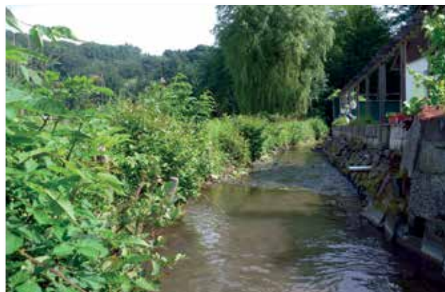
Die Anger vor der Maßnahme, es bestehen keine Entwicklungsmöglichkeiten, es herrscht Strukturarmut

Für die in der Anger vorkommenden Bachforellen und andere Fische wurden Fischunterstände als Rückzugsmöglichkeit angelegt und auf einer kleinen Insel eine Abbruchkante als Brutlegenheit für den Eisvogel hergerichtet.