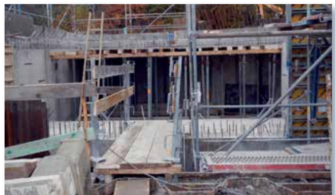
HRB Goldberger Teich Neubau des Überlaufbauwerks

Im Zuge der erforderlichen Sanierung des HRB ITTER/KUCKESBERG wurde Mitte Oktober der Auftrag für die Stahlwasserbauarbeiten erteilt. Bis zum Jahresende konnte die konstruktive Planung der Stahlwasserbauteile schon so weit vorangetrieben werden, dass erste Ergebnisse für die konkrete Ausführungsplanung der Betonbauwerke zur Verfügung standen.