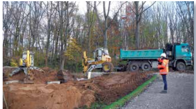
Bodenaushub und -abfuhr zwischen den Brückenwiderlagern der Deichöffnung in D-Hellerhof