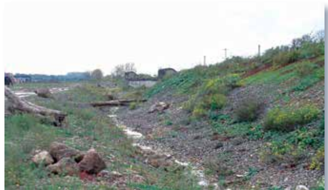
vor, während und nach der Umgestaltung