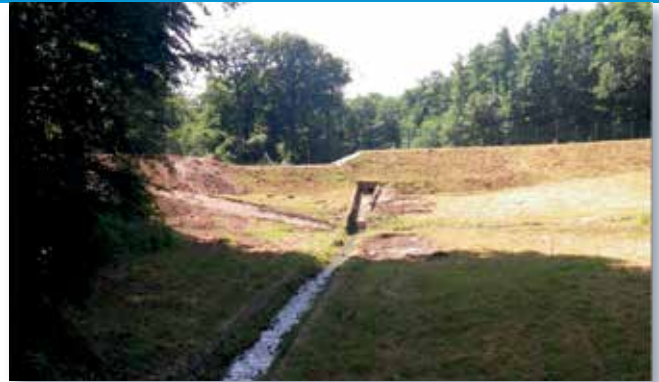
HRB Brucher Bach vor und nach Ertüchtigung des Erddammes

Am HRB BRUCHER BACH/ECKBUSCH wurde Mitte Juli mit den Bauarbeiten begonnen. Bis Ende des Jahres waren die Betonbauwerke sowie die Erhöhung und Ertüchtigung des Erddammes bereits weitgehend fertiggestellt. Mitte 2014 sollen die restlichen Arbeiten, im Wesentlichen noch der Stahlwasserbau, die Wiederherstellung des Baumfeldes sowie der Zaun- und Wegebau abgeschlossen sein.