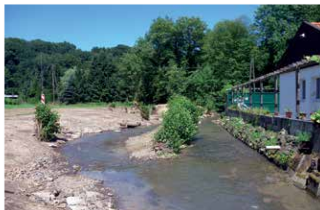
Unmittelbar nach Fertigstellung der Maßnahme, das Gewässer kann sich nun in die Breite entwickeln