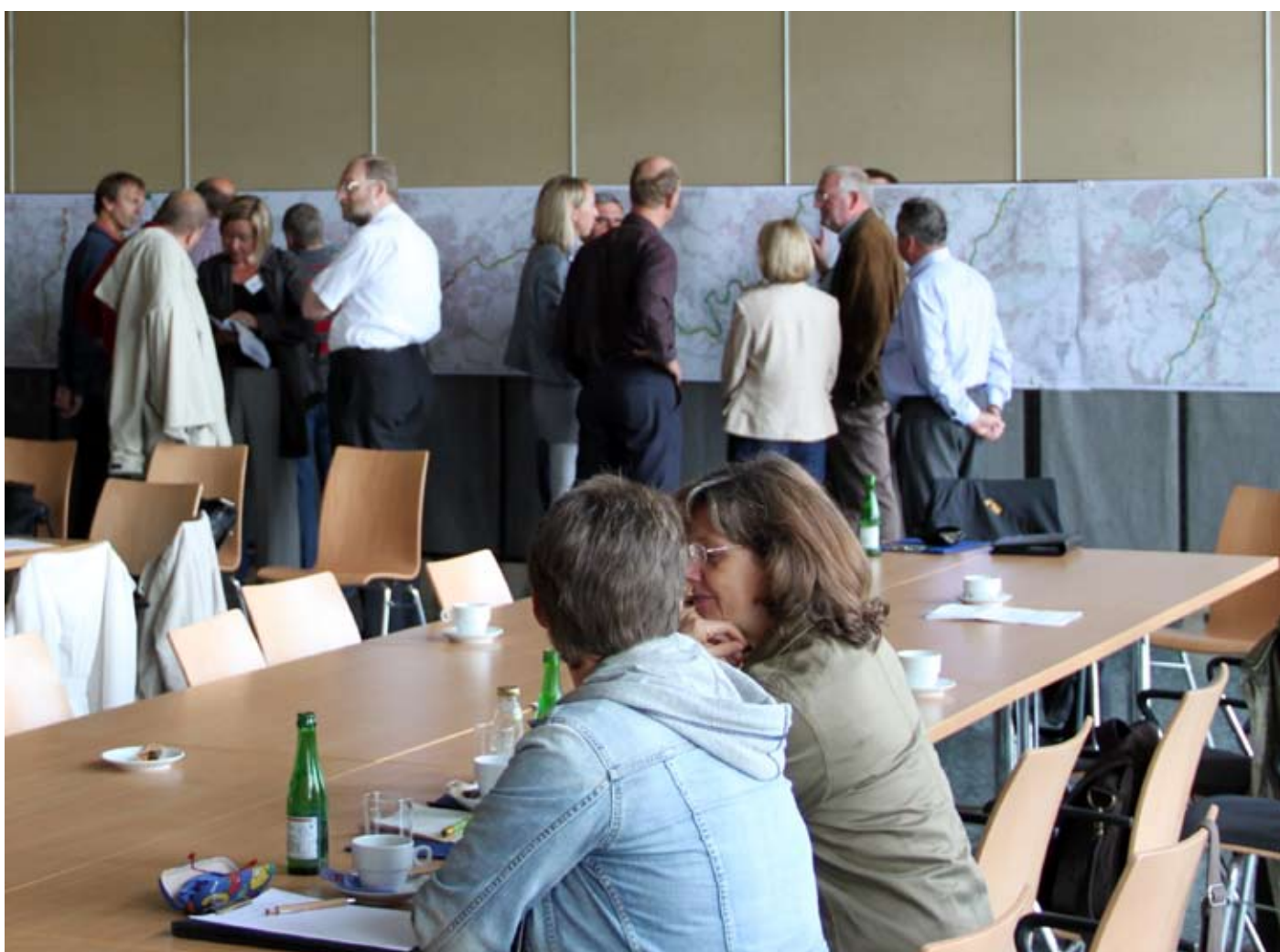
1. Workshop Verbandsgebiet Süd in Haan-Gruiten