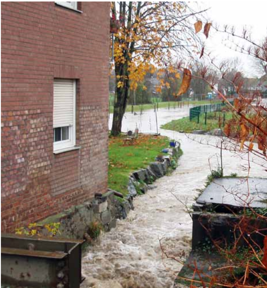
Anger im Bereich „Mühle Wolff“